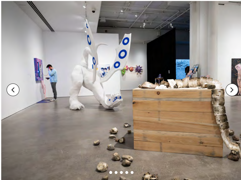
L'exposition illustre la curiosité et la vivacité créatrice des étudiantes et étudiants.

La Galerie de l'UQAM présente les travaux de la cohorte finissante du baccalauréat en arts visuels et médiatiques.