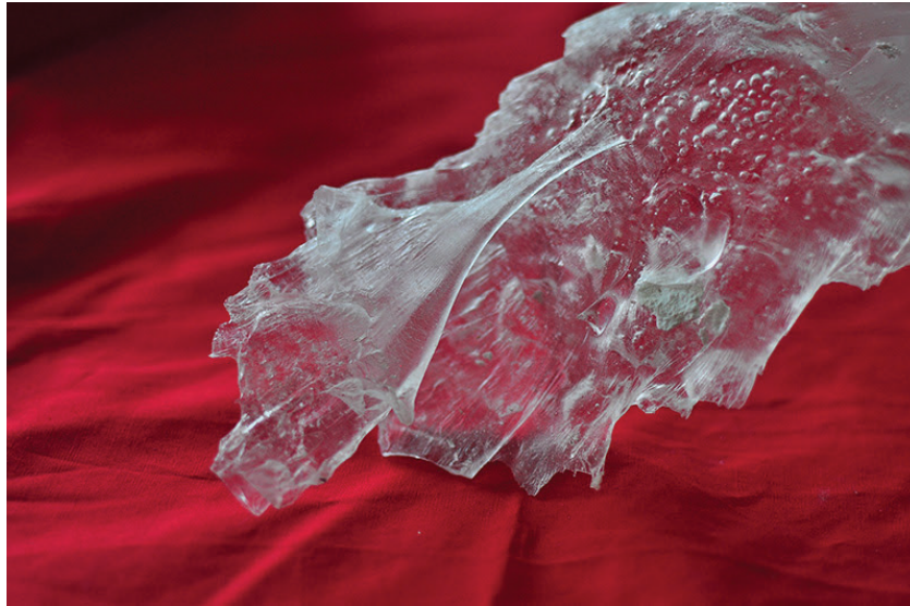
Alexia Laferté-Coutu, Édifice Allan : La lave de Pompei , 2018, molten glass