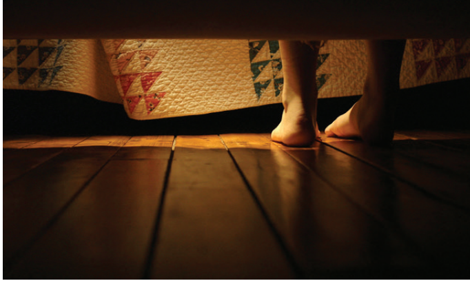
Olivia Boudreau La brèche 2012 (extrait de la vidéo / video still)