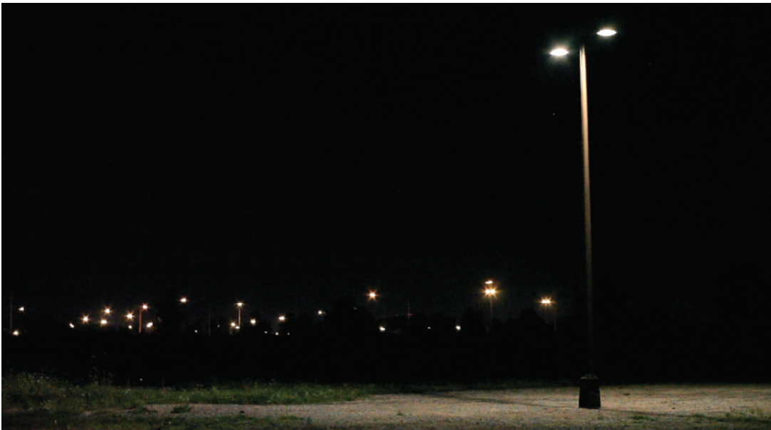
Michel de Broin Tranche dans la noirceur / Cut in the Dark 2010 (extrait de la vidéo / video still)