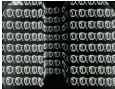
Gary Hill, Videograms , 1980-81

Du 15 avril au 4 juillet 2015, la Galerie d'art Foreman présente, dans le cadre de sa série d'expositions VIDÉOTANK , une onzième œuvre vidéo, Videograms de Gary Hill, créée en 1980-81. Structurée comme un ensemble de poèmes haïku, l'œuvre de Gary Hill étudie les liens entre la vision, le son, le langage et les formes changeantes de la technologie. Chaque « vidéogramme » se rattache de façon littérale ou conceptuelle au texte parlé de Hill, qui est traduit visuellement par des formes abstraites. Hill brouille la frontière entre le vocabulaire acquis et la réponse sensorielle innée, permettant à l'observateur de produire ses propres récits.