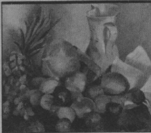
Huile sur toile, 1936