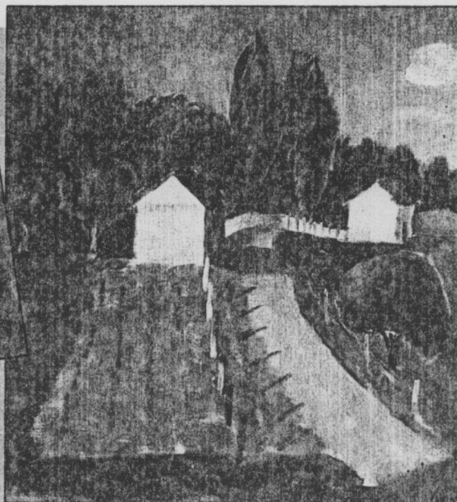
Le bout du village (1944)