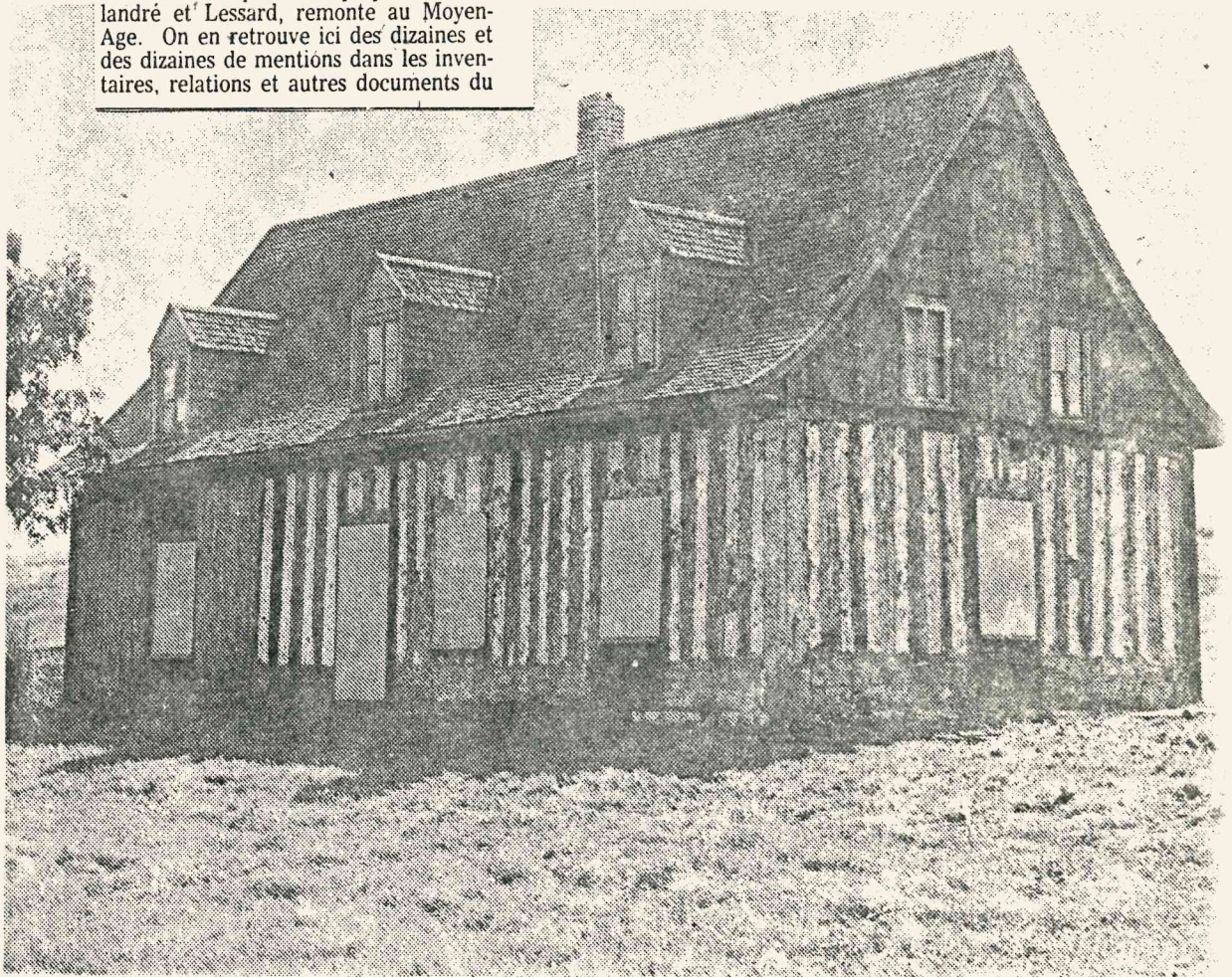
Cette maison en colombage pierroté, qui s'élève à Rimouski-Est, constitue le coeur de l'exposition qui s'est ouverte hier soir à l'UQAM sur la maison rurale traditionnelle. Ce type de maison était fort courant au début de la colonie française et jusque vers 1740 mais elle est devenue aujourd'hui très rare. De fait, on n'en connaît actuellement que cinq spécimens en Amérique du Nord, dont deux aux États-Unis (vallée du Missisipi). La maison tire son nom de fait qu'elle était de pièces de bois placées verticalement et entre lesquelles on mettait un mélange d'argile et de pierres. Elle était peu adaptée à notre climat d'où sa disparition rapide.

Signalons que l'exposition organisée par la Collection d'Art de l'UQAM durera du 4 au 23 décembre. La salle d'exposition située au 3450, Saint-Urbain (pres de Sherbrooke) est ouverte gratuitement de 12h00 à 20h00 du lundi au vendredi, et de 12h00 à 17h00 le samedi et le dimanche.